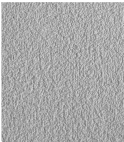
ФРАКЦИЯ 0,3-0,7 мм