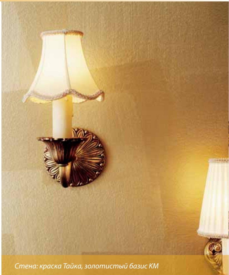
Стена: краска Тайка, золотистый базис КМ

Фон под лазурь/цвет для усиления эффекта: X393