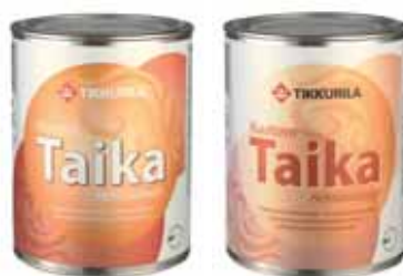
Крошущая перламутровая краска KM