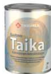
Лессирующая двухцветная перламутровая лазурь