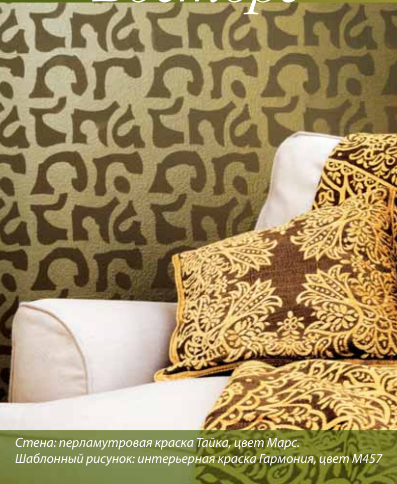
Стена: перламутровая краска Тайка, цвет Марс. Шаблонный рисунок: интерьерная краска Гармония, цвет M457

З авораживающий рисунок шаблоном сделан нанесением матовой краски для интерьеров Гармония на блестящую поверхность, покрытую перламутровой краской Тайка, и наоборот.