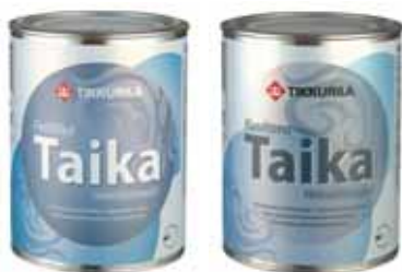
Крошущая перламутровая краска HM