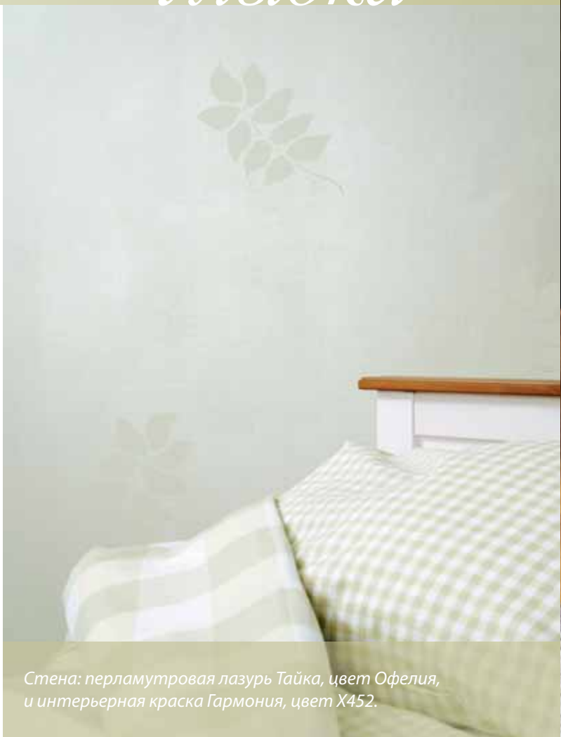
Стена: перламутровая лазурь Тайка, цвет Офелия, и интерьерная краска Гармония, цвет X452.

Фон под лазурь/цвет для усиления эффекта: X452