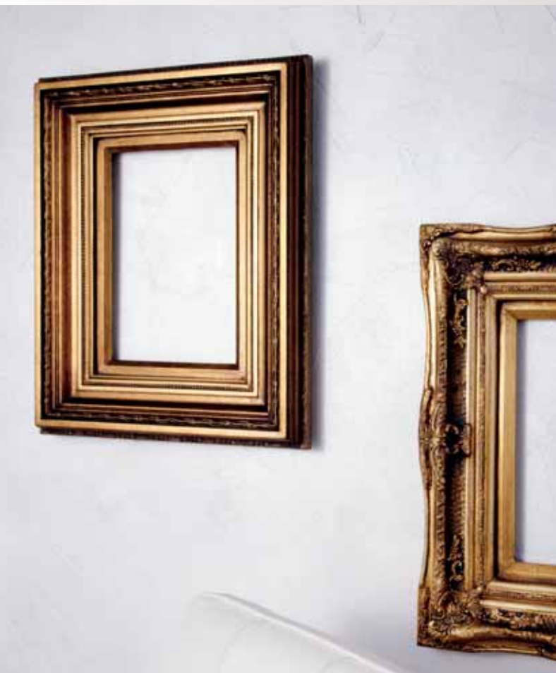
Стена: декоративное покрытие Кевют-Рае и перламутровая лазурь Тайка, серебристый базис

Фон под лазурь/цвет для усиления эффекта: J497